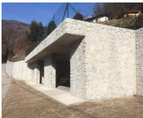
Figura 2 – voltatesta d'angolo con fuga mascherata

Nello specifico si possono realizzare voltatesta con fuga mascherata che permette la continuità d'angolo, oppure in testa ai pannelli per definire la chiusura della muratura.