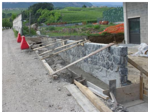
Figura 3 - Voltatesta in testa su muro monolitico