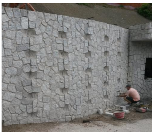
Figura 2 - fase di mascheramento della fuga

Alla fine della posa in opera dei pannelli prefabbricati le pietre vengono posizionate e successivamente fugate per realizzare una tessitura omogenea finale.