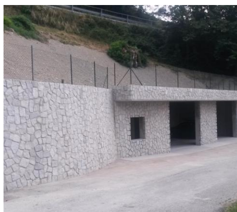
Figura 3 - fuga mascherata