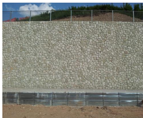
Figura 5 - fuga mascherata