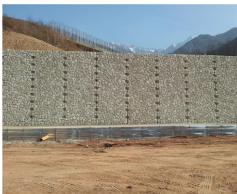
Figura 4 - fase precedente al mascheramento della fuga